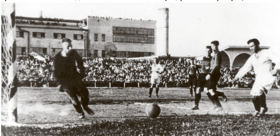
1950 год. Стадион «Дзержинец». Товарищеская встреча по футболу «Дзержинец» (Коломна) – «Динамо» (Москва), ветераны.