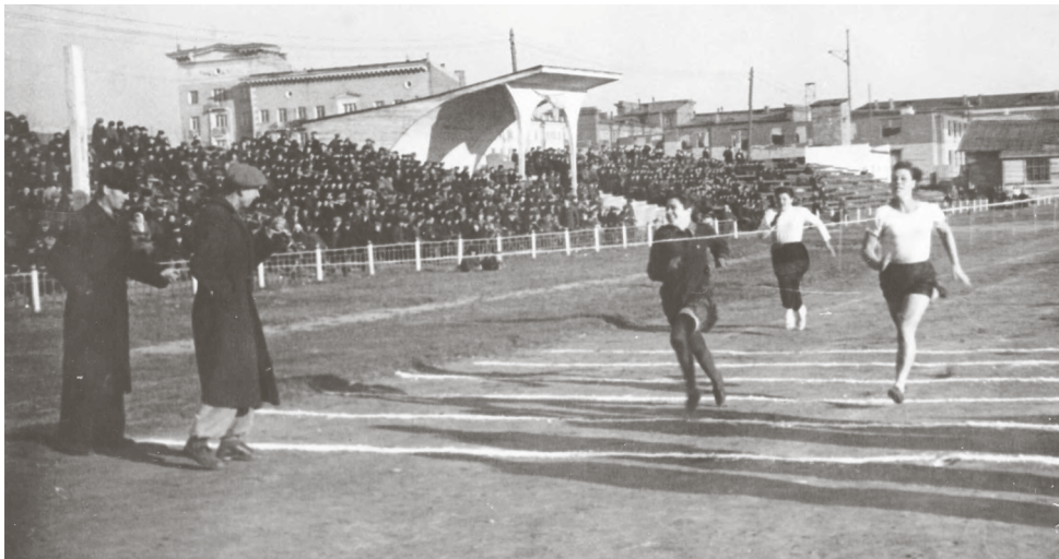
30-е годы, стадион «Дзержинец».