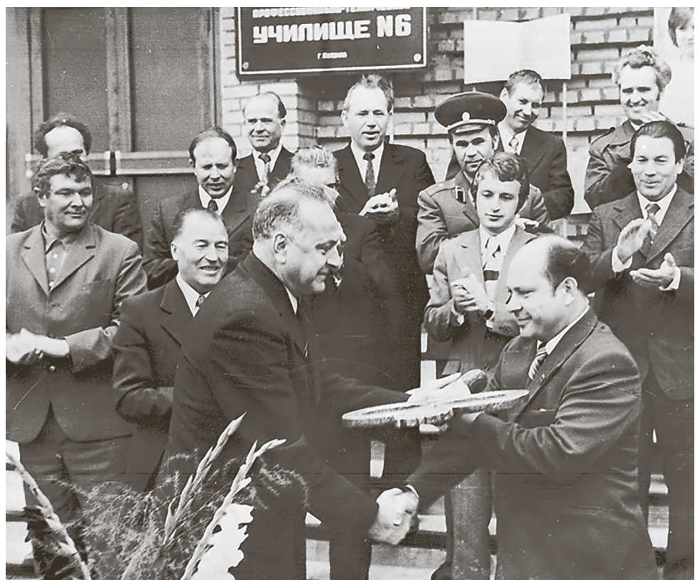
1976 год. Открытие ГПТУ-6

Внимание уделялось не только привлечению работников из других регионов, но и качественному образованию местной молодёжи, которая в дальнейшем могла пополнить ряды сотрудников предприятия. Специально для обеспечения рабочими кадрами в 1976 году завод