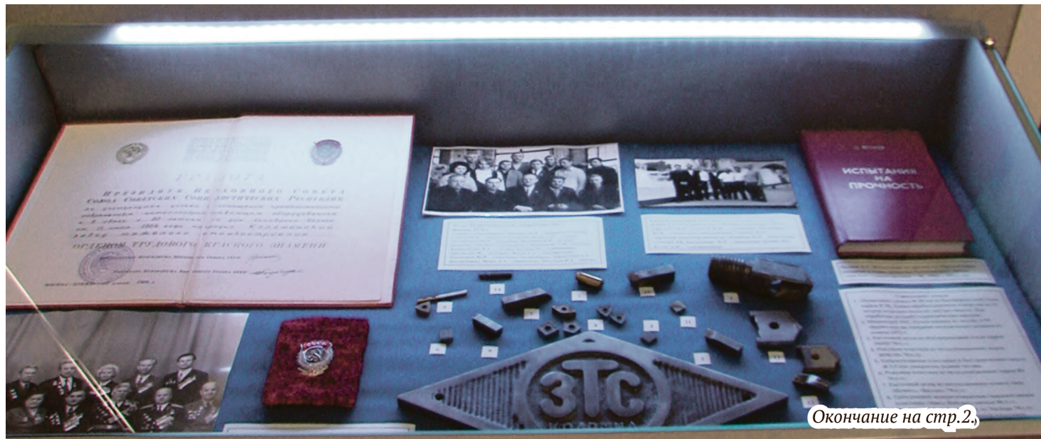
Окончание на стр.2.,