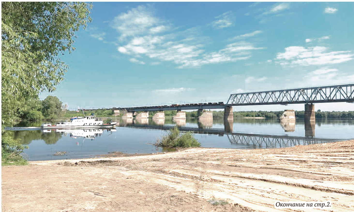
Окончание на стр.2.

Пляж и зона отдыха на Коломенке в этом году из-за работ по благоустройству открыты не будут. Однако это совсем не