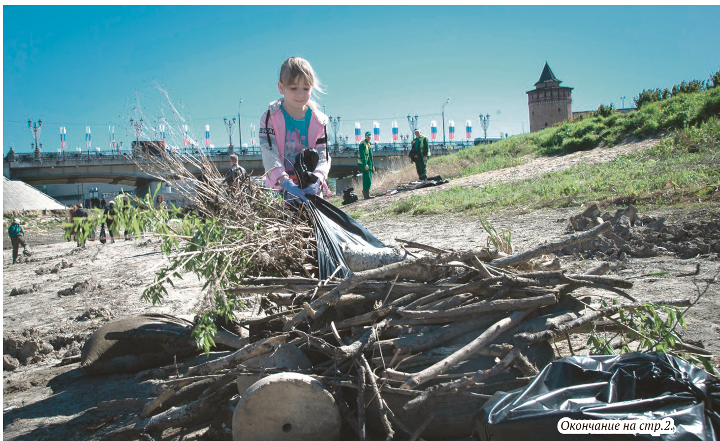
Окончание на стр.2.

В субботнике приняли участие более 300 человек, многие пришли сюда с детьми, ведь лучше всего показывать бережное отношение к природе на личном примере. Под весёлое журчание Коломенки, а сейчас она больше напо-