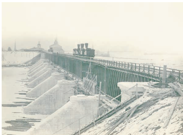
Первый поезд прошёл по Окскому мосту 19 февраля 1865 года.

временный мост, выполненный из дерева. На нём был уложен железнодорожный путь для переброски товарных вагонов с одного берега на другой. Правда, тянули вагончики лошади, ведь шаткие устои вряд ли бы выдержали вес паровоза. Осенью Струве приобретает в аренду более 10 десятин земли у крестьян села Боброва с правом «производить разные постройки, как заводские, так и фабричные» и сооружает на левом берегу Оки, у её слияния с Москвой-рекой, временные мастерские. Здесь то и начи-