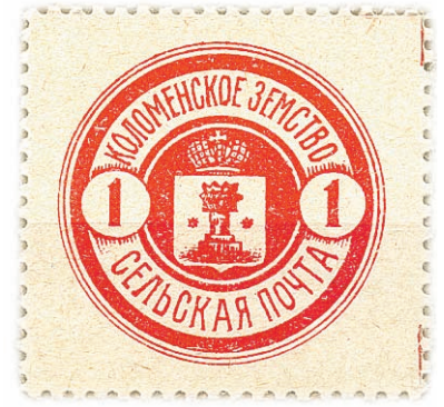
Марка от 1916 г.

привело к изменению тарифа на доставку корреспонденции, и с 1889 года стоимость простых писем и объявлений стала обходиться 3 коп., заказных писем и посылок – 5 коп., недельной пачки периодической печати – 2 коп., денежных писем – 1 коп. с одного рубля.