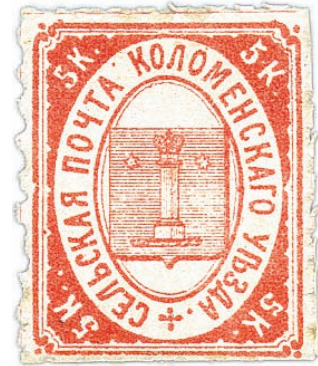
Первая марка. 1870 г.