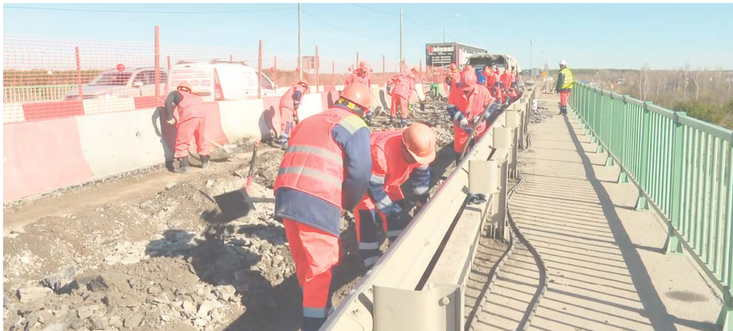
Окончание на стр. 2.

– Согласно государственному контракту, к работам мы должны были приступить в середине мая. И, всё-таки,