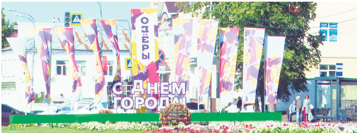
Окончание на стр. 2.

В этот день не могли забыть озерчане и о тех людях, которые в сороковые-