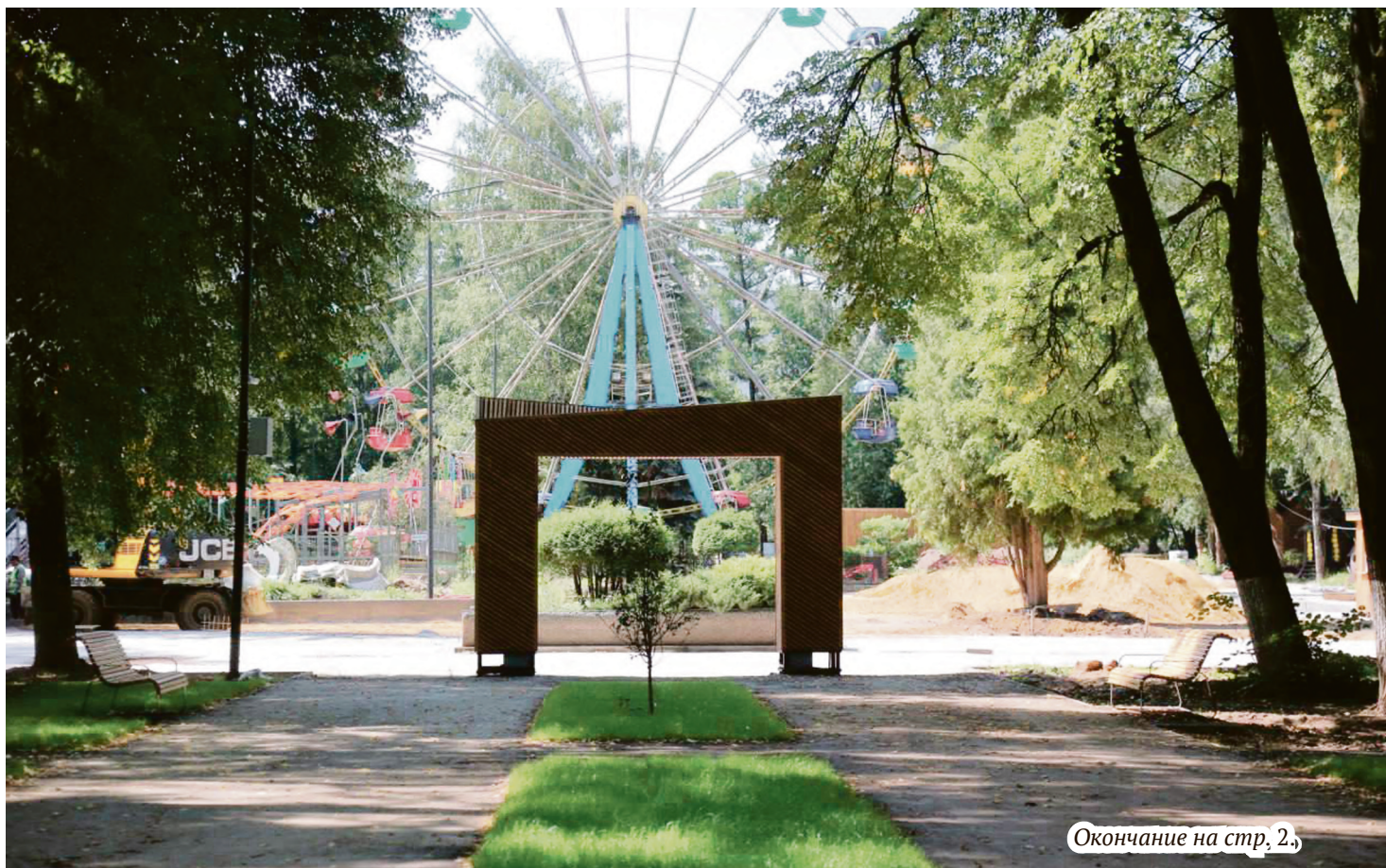
Окончание на стр. 2.