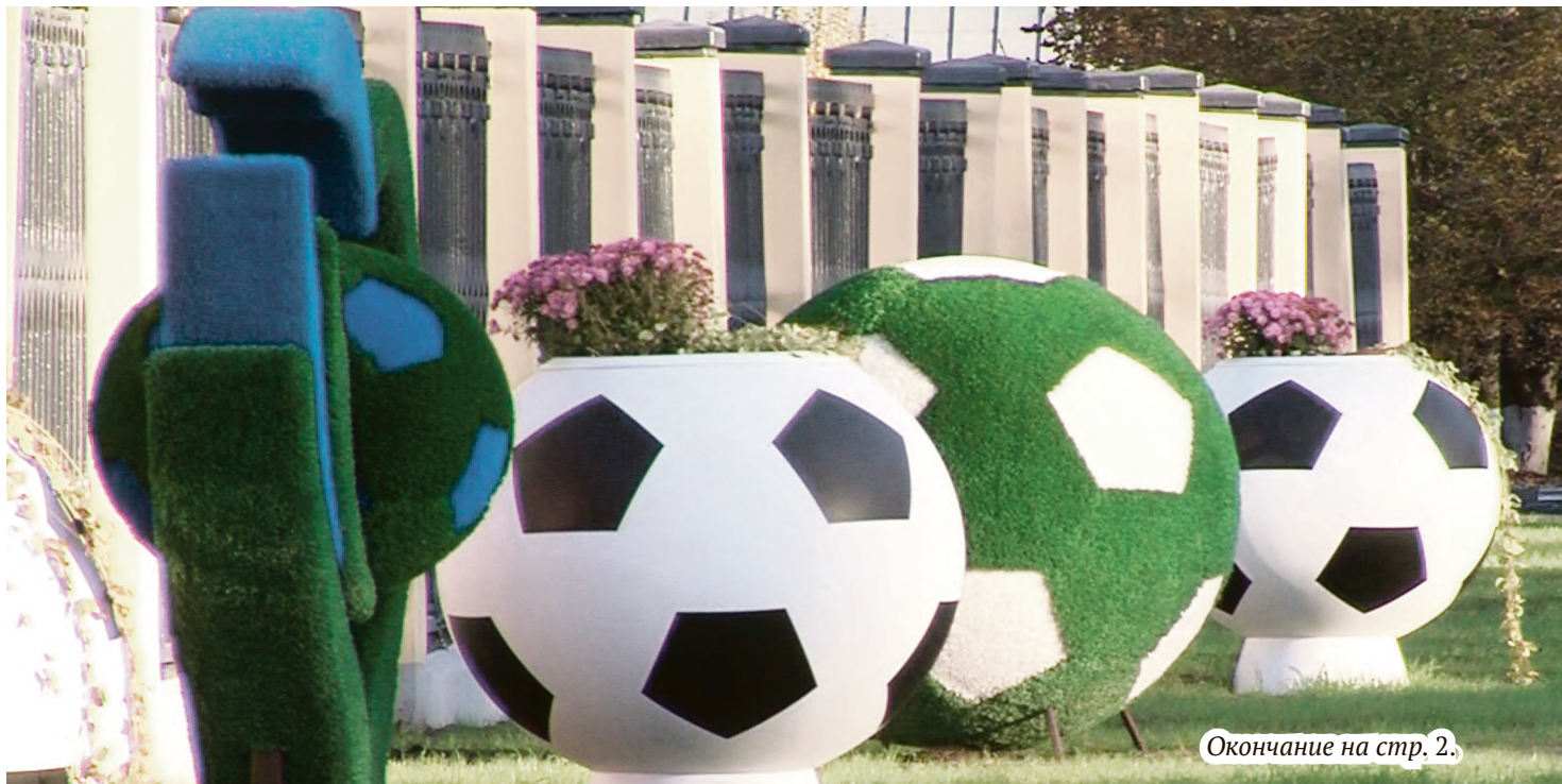
Окончание на стр. 2.