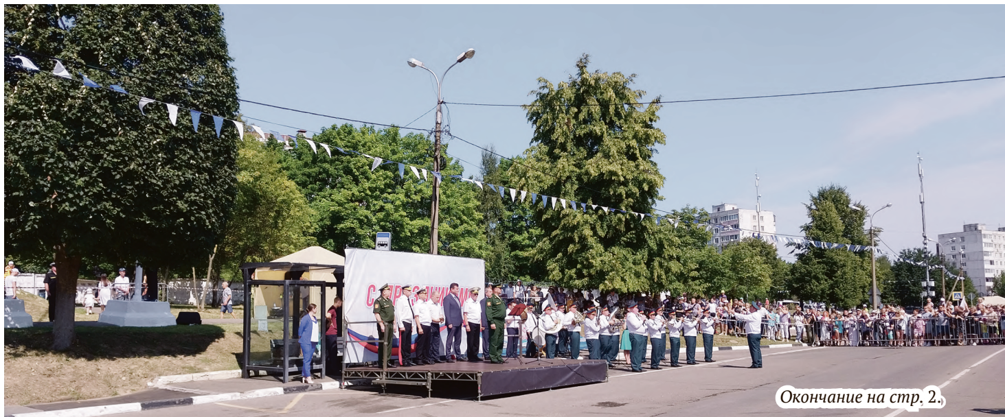
Окончание на стр. 2.