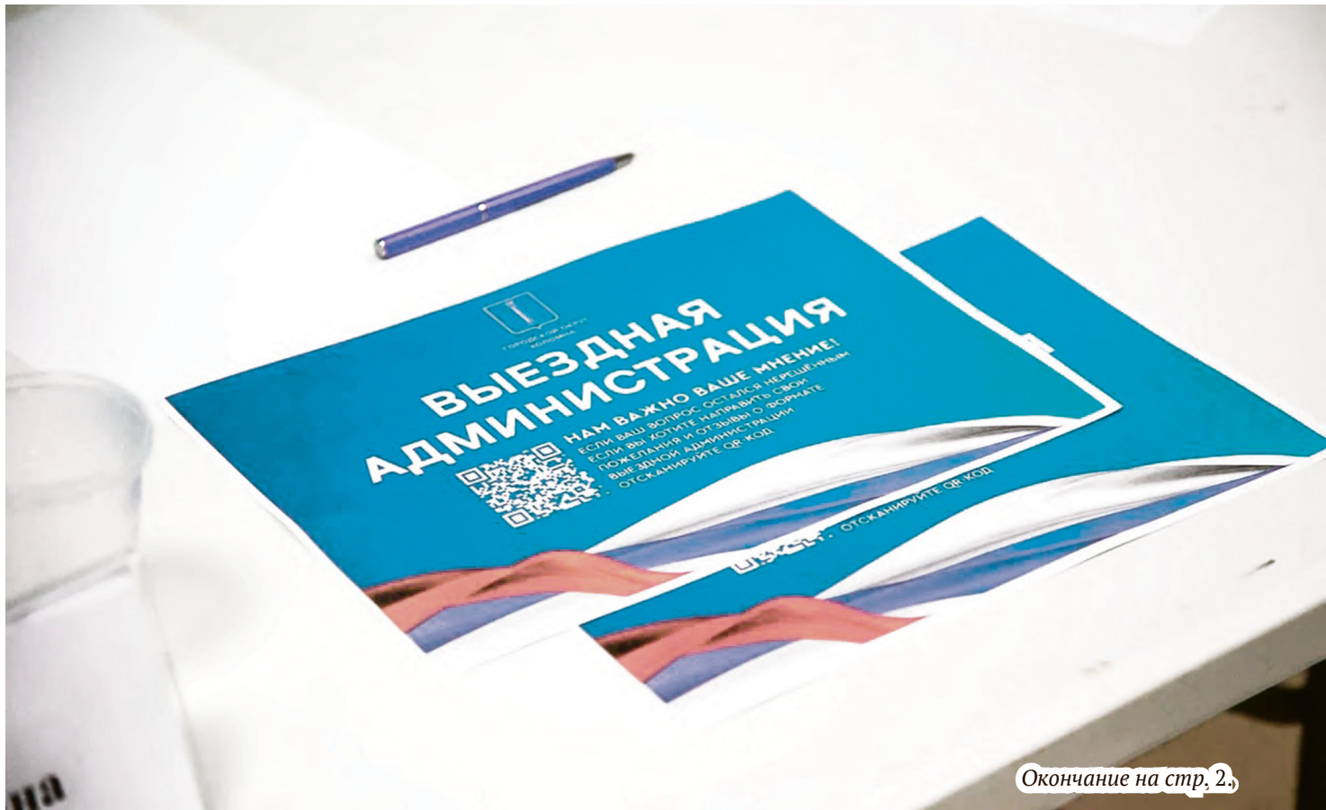
Окончание на стр. 2.