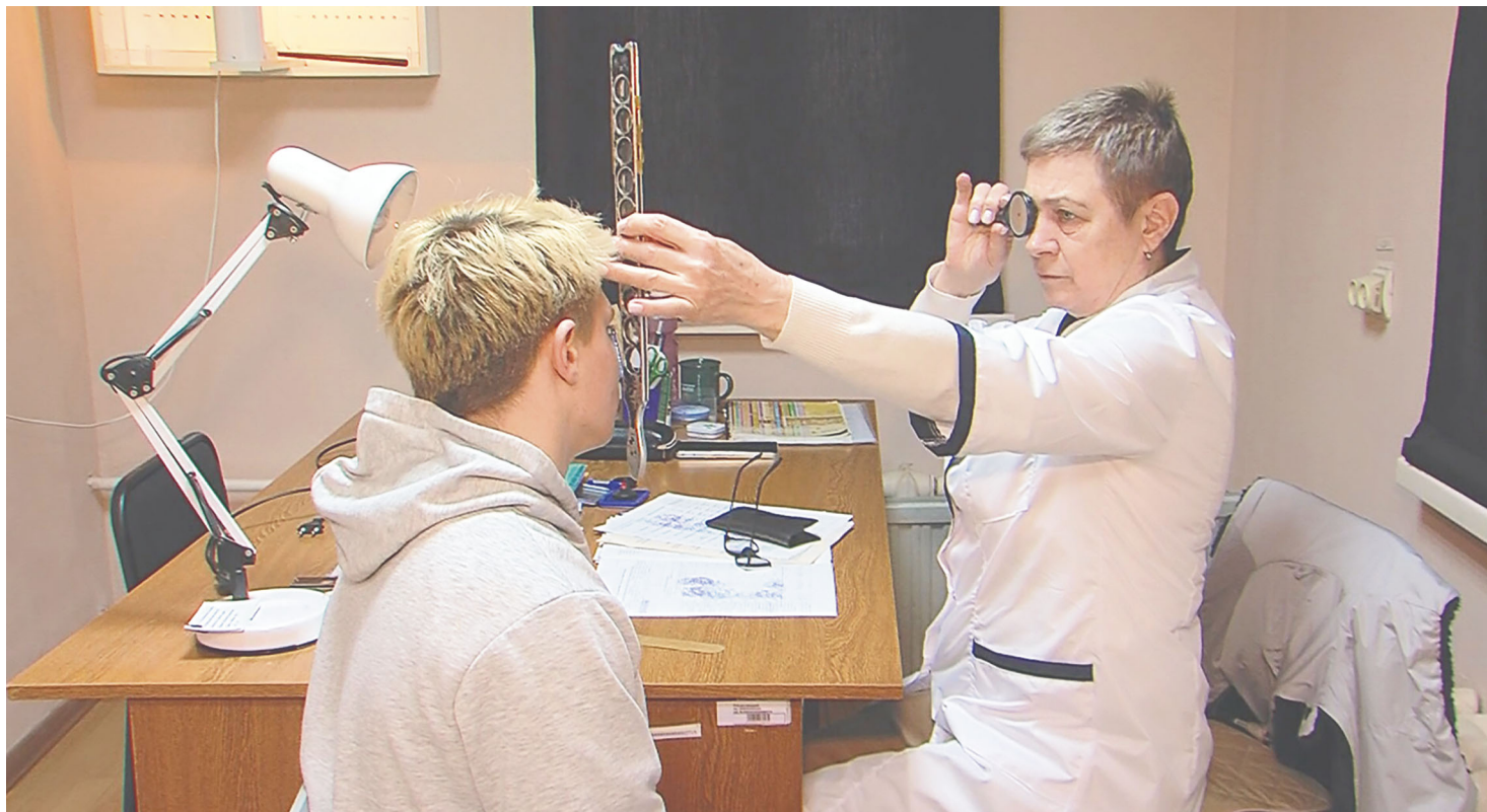
Окончание на стр. 2.

вобранцев по родам войск и воинским частям происходит не в Коломне, а на областном сборном пункте в Балашихе. Как всегда, призыву предшествовала большая подготовительная работа. И вот теперь ежедневно на комиссию приходят не менее 30-35 молодых коломенцев и озерчан. Перед тем как призывники поступят в распоряжение медиков, с ними работают сотрудники военкомата, прежде всего ради уточнения анкетных данных, жизнь ведь так изменчива. Ну а тем, кому необходимо дополнительное медицинское обследование, обязательно предоставляется такая возможность. Никаких изменений в оценке здоровья новобранцев, в списке болезней, влияющих на прохождение военной службы по призыву, не произошло. При необходимости молодой человек будет освобождён от воинской обязанности по состоянию здоровья. Между тем медики военкомата оценивают состояние здоровья призывников в целом положительно, хотя с точностью на все сто сказать затруд-