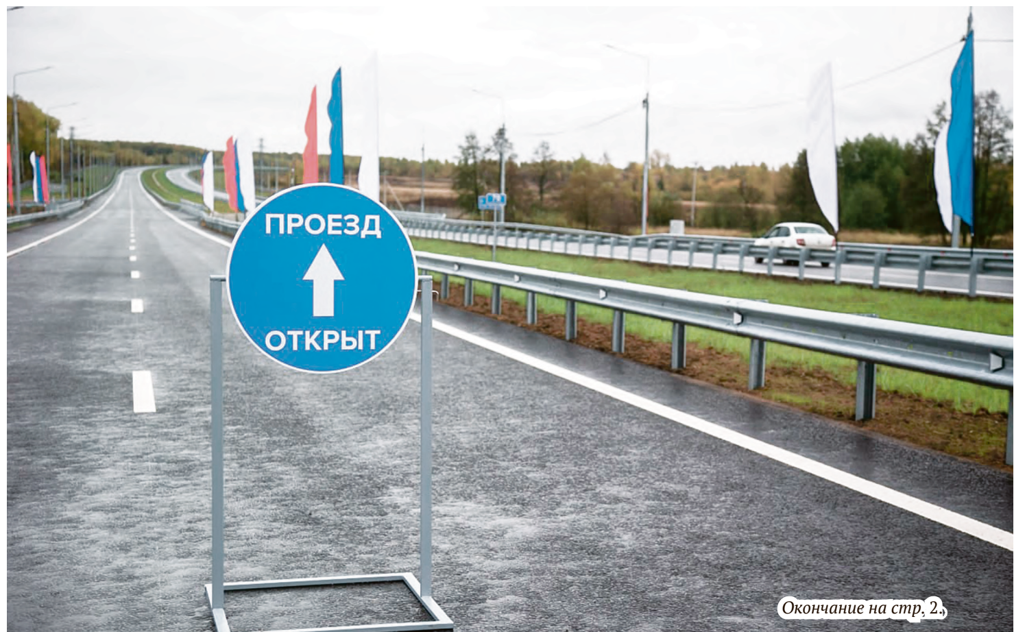
Окончание на стр. 2.

– В рамках строительства автомобильной дороги было построено четыре полосы движения, транспортные потоки разделены осевым барьерным ограждением, – рассказал заместитель начальника ФКУ «Центравтомагистраль» Тимур Берхамов. – На протяжении всего участка установлены линии освещения. Расчётная скорость движения на этом участке – 110 километров в час. При строительстве участка переустроены нефтяные и газовые трубопроводы, построены семь путепроводов, четыре моста и две транспортные развязки. На протяжении всей трассы установлены