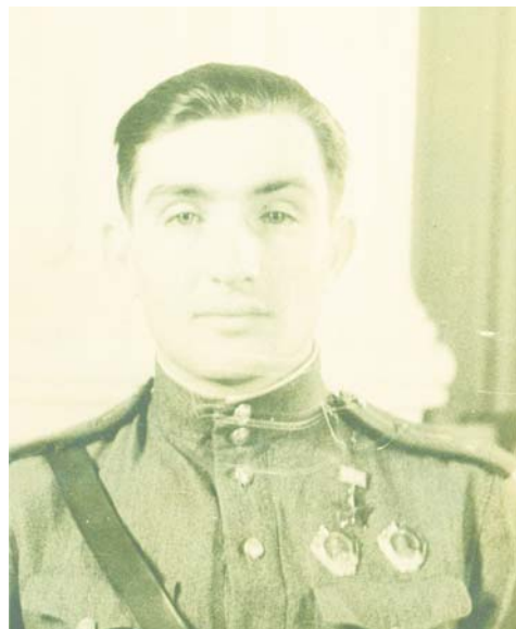
С. И. Захаров в день вручения Золотой Звезды Героя