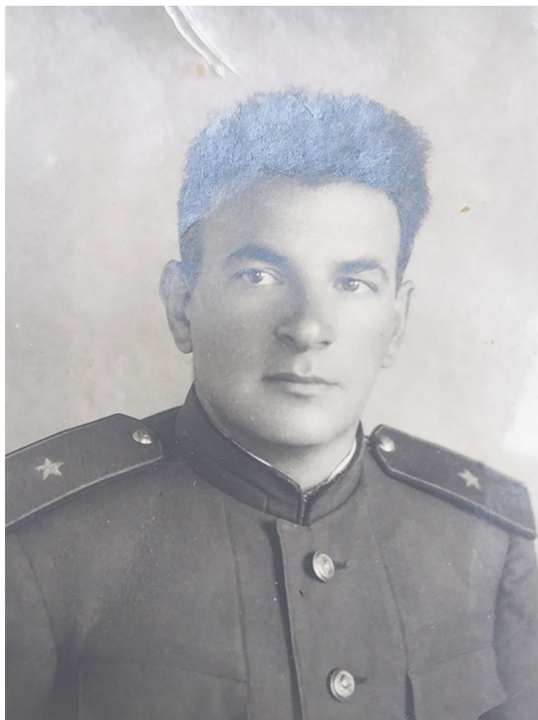
Наум Эммануилович Носовский