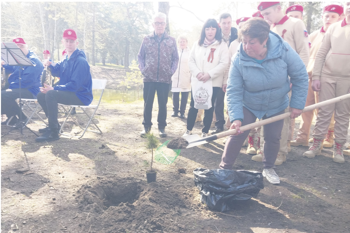
Окончание на стр. 2.